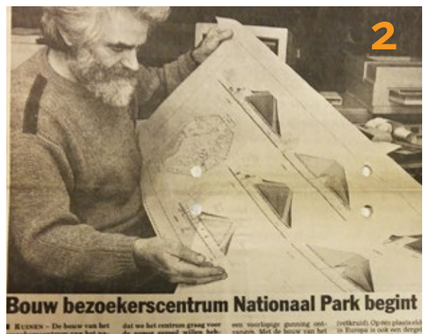
Bouw bezoekerscentrum Nationaal Park begint

■ BEUKEN - De bouw van het bezoekerscentrum van het na- dat we het centrum graag voor de zomer gereed willen hebben. Met de bouw van het ven. voorlopige gunning ont- (verkleint) Op het plaatselijk in Europa is ook een dergin