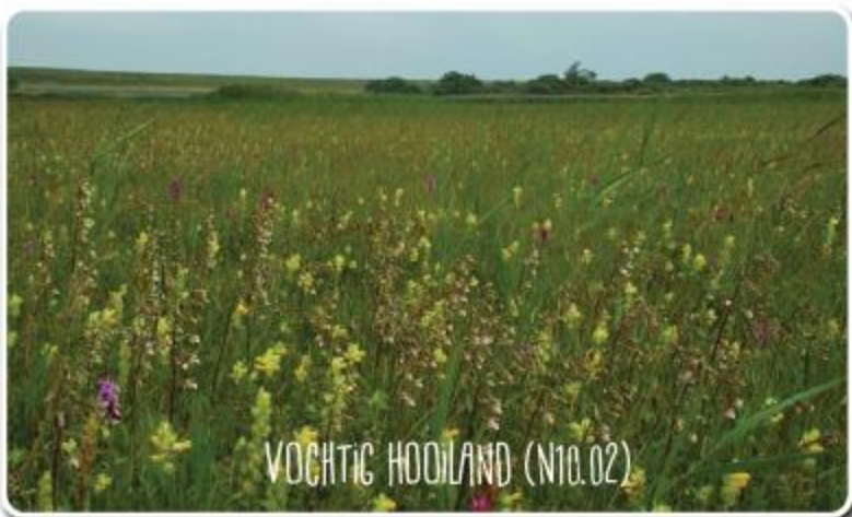
VOCHTIG HOOLAND (N10.02)