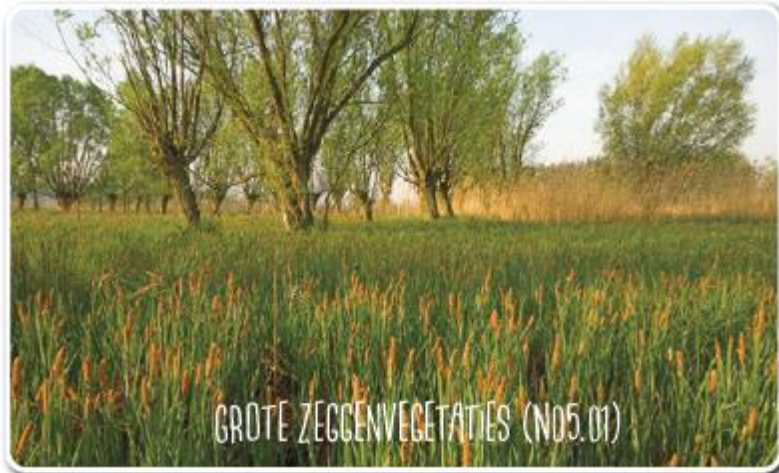
GROTE ZEGGENVEGETATIES (N05.01)